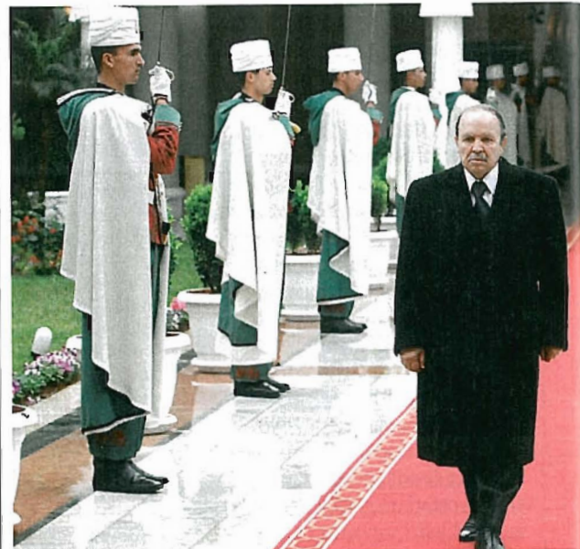
BOUTEFLIKA Predsjednik Alžira već mjesecima živi u samonametnutoj izolaciji i ne oglašava se od tuniskih nemira

U Maroku, trećoj magrepskoj zemlji, vlada kralj mlađe generacije Mohamed Šesti. On je naslijedio svog oca, kralja Hasana, koji je bio šarmantni prijatelj europskih lidera, ali