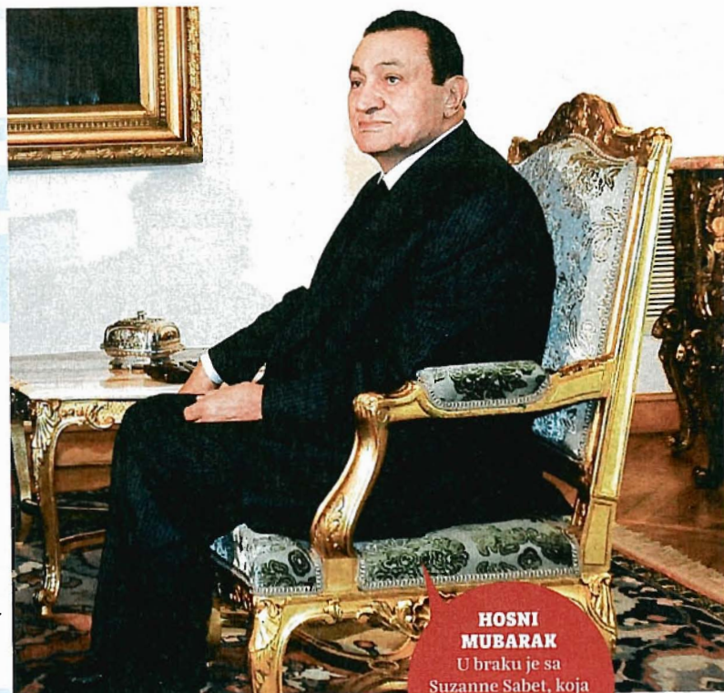
HOSNI MUBARAK U braku je sa Suzanne Sabet, koja je sa sinom Gamalom otputovala u London sa 80 kufera

Površina: 1.001.450 km 2 Broj stanovnika: 85 milijuna Glavni grad: Kairo (18 milijuna stanovnika) BND per capita: 6374 dolara Predsjednik Hosni Mubarak (r. 1928) na vlasti je od 1981., a od 1975. bio je potpredsjednik Anvaru Al Sadatu. Transparency International rangira ga kao najmanje korumpiranog arapskog lidera. Većina procjena navodi dvatriga milijuna eura, ali neki izvori bogatstvo njegove šire obitelji procjenjuju i do 40 milijuna dolara. Predsjednik u prisilnom odlasku Mubarak ostavlja iza sebe novi kabinet premijera Ahmeda Šafika. Na idućim izborima očekuje se vrlo jak utjecaj Muslimanskog bratstva.