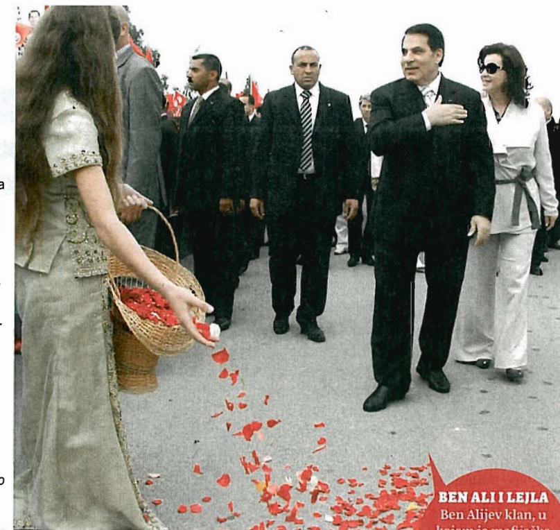
BEN ALI I LEJLA Ben Alijev klan, u kojem je mafijaška obitelj njegove žene, sad je u Kataru, a on je sa suprugom Lejlom u Džedi

Stekla nezavisnost od Francuske 1956. Površina: 163.610 km 2 Broj stanovnika: 10 milijuna Glavni grad: Tunis BND per capita: 8264 dolara Sadašnji predsjednik naslijedio je odbjegloga Zine-el-Abidina Ben Alija (r. 1936.), koji je na vlasti bio od 1987. i srušen je narodnim ustankom. Diktator Ben Ali od Tunisa je napravio polupolicijsku državu, ali i najkompetitivniju afričku ekonomiju. Procjenjuje se da ima osobno bogatstvo od pet milijardi eura. Politička snaga velikog utjecaja koja će igrati ulogu u Tunisu jest El-Nahda, što je vodi Rached Ghannouchi, profesor filozofije koji je proveo dvadeset godina u egzilu.